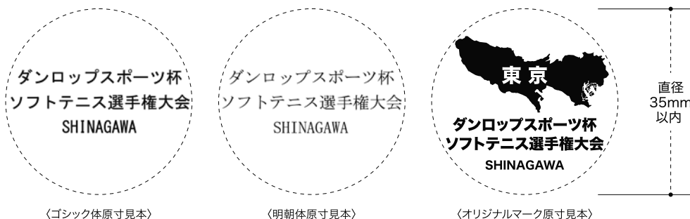
〈ゴシック体原寸見本〉

※文字が潰れそうな場合は弊社で調整する場合があります。 ※マークやネームの商標及び著作権についての責任は 全てお客様に帰属しますので予めご了承願います。